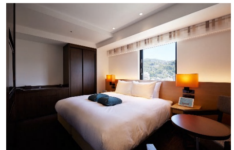
参考画像 ホテルフォルツァ長崎 デラックスダブルルーム

ホテル名称： ホテルフォルツァ札幌駅前(仮称) 所在地： 札幌市中央区北3条西2丁目 JR札幌駅 南口 徒歩4分 地下鉄東豊線「さっぽろ駅」13番出口より徒歩2分 敷地面積： 894平米(270坪) 室数： 約200室 開業時期： 2019年春予定 事業主： 福岡地所株式会社 設計： 株式会社山下設計 施工： 未定 デザイン： 株式会社カッシーナ・イクスシー