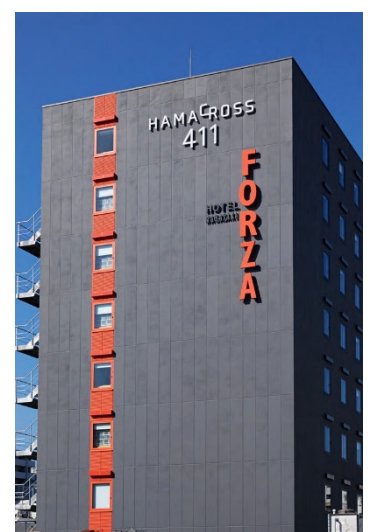
参考画像 ホテルフォルツァ長崎