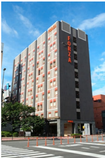
参考画像 ホテルフォルツァ大分