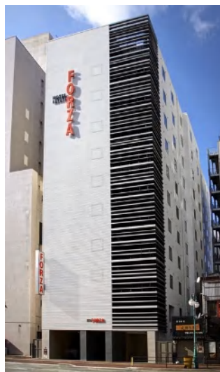
参考画像 ホテルフォルツァ博多（筑紫口）