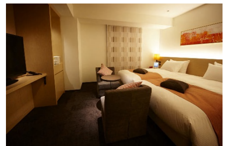
参考画像 ホテルフォルツァ博多(筑紫口) リラクシングツインルーム

ホテル名称： ホテルフォルツァ大阪北浜(仮称) 所在地： 大阪市中央区今橋2丁目 京阪本線、堺筋線「北浜駅」徒歩1分 敷地面積： 822平米(248坪) 室数： 約200室 開業時期： 2019年夏予定 事業主： 中江産業株式会社 設計： 株式会社山下設計 施工： 未定 デザイン： 有限会社バジック